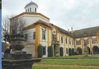
Zámecký areál v Cholticích