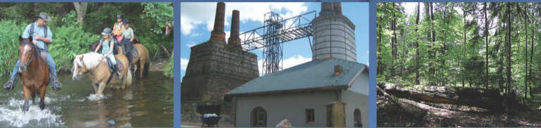
Ranč LL Kovářov