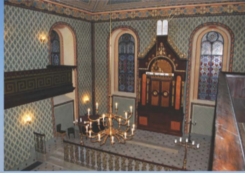
Synagoga v Heřmanově Městci