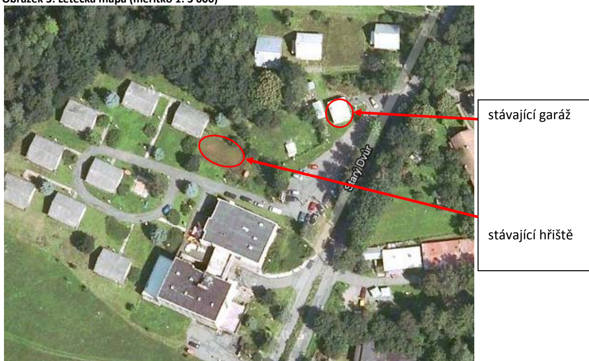
Obrázek 3: Letecká mapa (měřítko 1: 3 000)