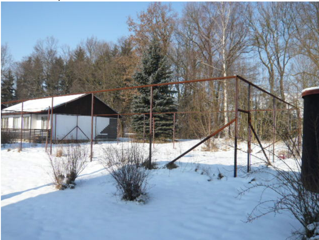
Obrázek 4: Současný stav hřiště

V současnosti se v místě předmětu projektu nachází nevyužívaná garáž a zanedbané sportovní hřiště. Aktuální stav dokumentují následující fotografie.