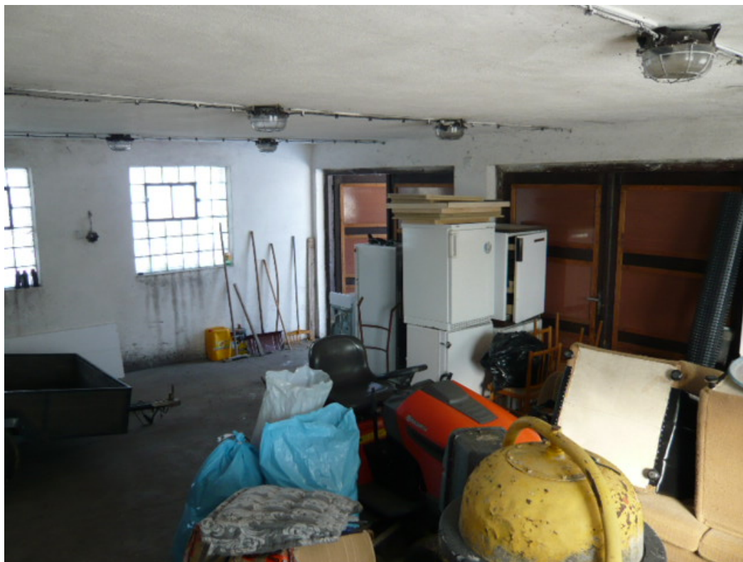
Obrázek 7: Stávající garáž - interiér