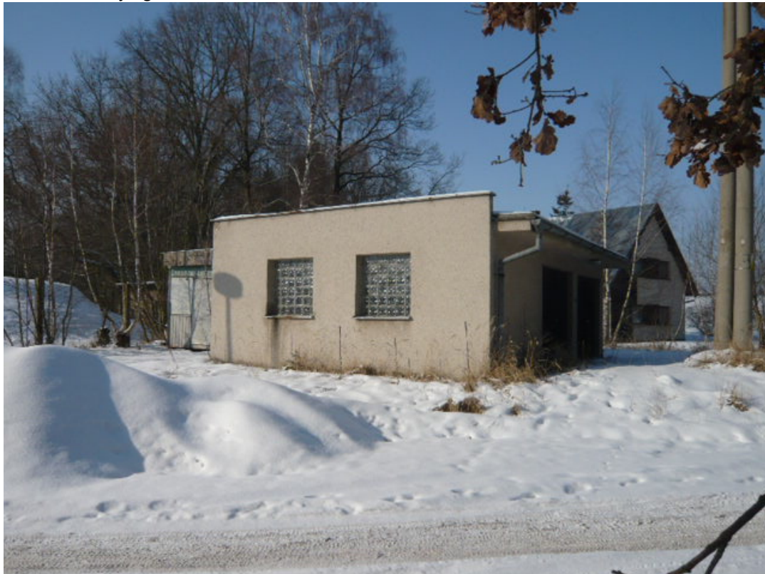
Obrázek 5: Stávající garáž