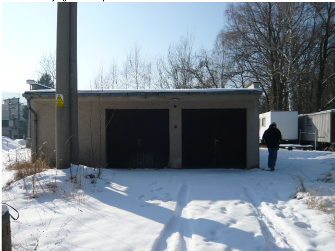
Obrázek 6: Stávající garáž – čelní pohled